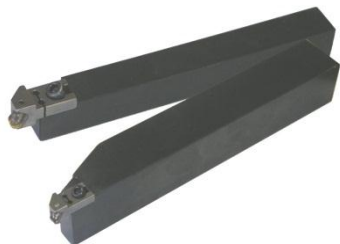
バニシングバイト

活躍している業界: 旋盤加工業(ロール材、電機、自動車、医療) 導入事例: 面粗度の要求品質が高いワークを旋盤で仕上げられる 売れるトーク: 「旋盤で鏡面が簡単に出来る事、ご存知ですか？」 価格帯: 5万~15万