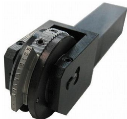
旋盤用マーキング

活躍している業界: 各種継手、インフラ、自動車業界 導入事例: 後工程での刻印を省略、工程集約による加工時間短縮 お客様の反応: 「え？旋盤加工で刻印も出来たら凄いじゃないか！」 価格帯: 20万~50万