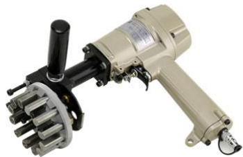
インパクト式刻印機

活躍している業界: インフラ、鉄鋼、建機業界 導入事例: 手打ち刻印からの切替導入、刻印品質向上 売れるトーク: 「危険な手打刻印は、やめたくありませんか？」 価格帯: 30万~80万